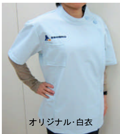
オリジナル・白衣