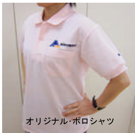
オリジナル・ポロシャツ